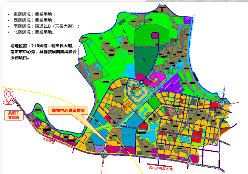
土地使用結構統計表

地理位置：21B國道—號天長大道， 南定市中心旁，具備發展商業與綜合 服務項目。